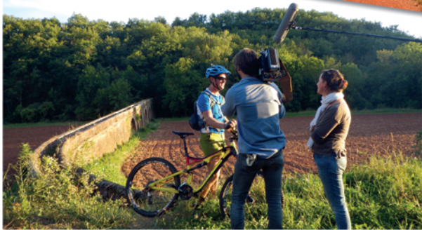
Aqueduc de Roysnac